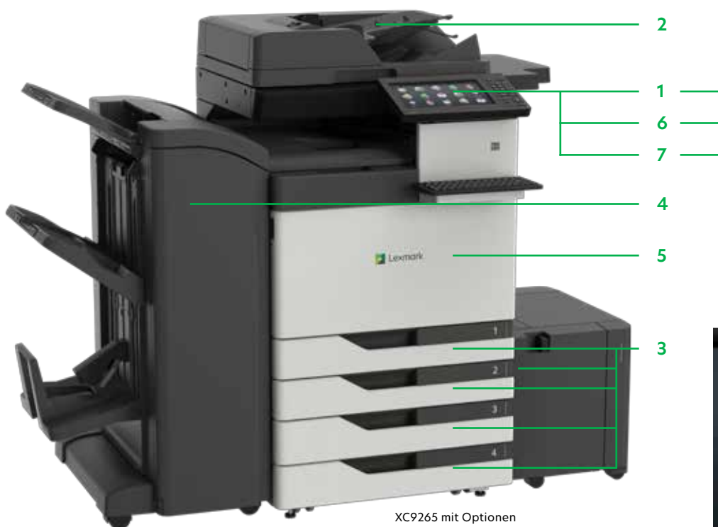
XC9265 mit Optionen

Drucken Sie Microsoft Office-Dateien, PDFs und andere Dokument- und Bildarten von Flash-Laufwerken, oder wählen Sie Dokumente auf Netzwerk-Servern oder Online-Laufwerken aus und drucken Sie sie.